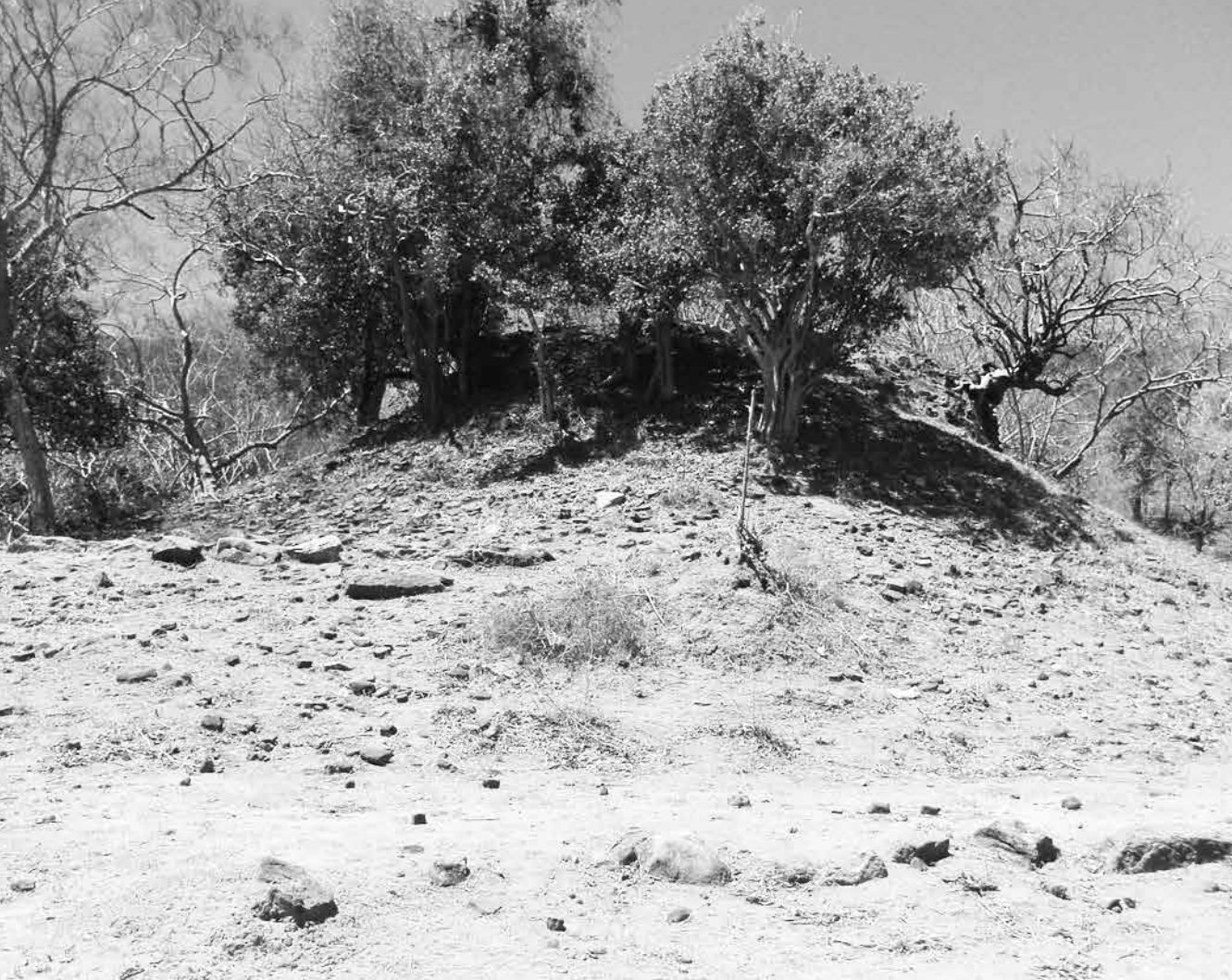
පුරාවිද්‍යාත්මක හටඹුන් සහිත ස්ථානයක්

විශින් බැට කන්හේ යුද්ධයෙන් තම ඉඩම් අහිමි වූ ජනතාව පමණක් නොවේ. යුද්ධයෙන් පසුවත් හිල නොවන ආකාරයන්ගෙන් තම ඉඩම් පැහැර ගැනීමට ලක් වූ පානම ආදී ගම් වල වැසියන්ය. අද වන විට මේ තත්වය බෙහෙවින් ඔඩු දුවා ගොස් තිබේ. සාම්පූර්ණ මෙන්ම උතුරේ තවත් බොහෝ තැන්වල වැසියන්ට පවා අත්ව තිබෙන්නේ මෙම ඉරණම ය.