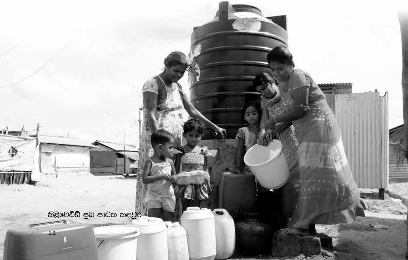
කිලිවෙඩ්ඩි සුඛ සාධක කඳවුර

එසේ හැවත පදිංචියට පැමිණි සාම්පූර් ජනයාට සිදුවූයේ, හැවත වරක් කඳවුරු ගතවීමටය. කිලිවෙඩ්ඩි, පට්ටිතිඩාල් හා කට්ටපර්ච්චාන් යන කඳවුරු තුළ අපාදක් විඳිමින් අද ඔවුහු බලා සිටින්නෝ, තම උපන් බිම හැවත ලබාදෙන තෙක්ය. එදා කොටින් යටතේ හිරවී සිටි ඔවුහු අද හමුදාව යටතේ ජීවත් වෙති.