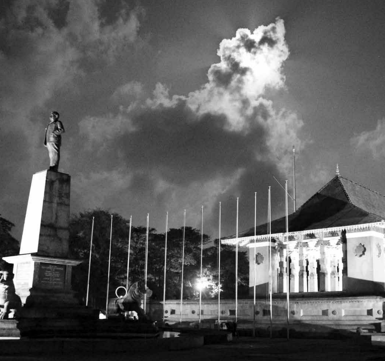
Full Moon @ Independence Square