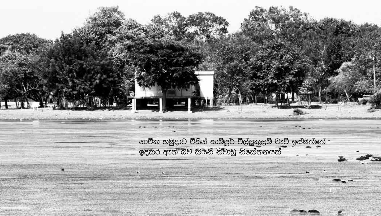
නාවික හමුදාව විසින් සාම්පූර්ණ විල්ලුකුලම් වැව් ඉස්මත්තේ ඉදිකර ඇති බව කියන නිවාඩු නිකේතනයක්

'සාම්පූර්ණ ප්‍රදේශය ත්‍රිකුණාමලය වරායට මුහුණලා තිබෙන ආරක්ෂාව අතින් ගත්තාම ඉතාමත් වැදගත් ස්ථානයක්. පසුගිය කාලයේ සාම්පූර්ණ සිට ත්‍රිකුණාමලය වරායට කාලතුවක්කු ප්‍රහාර පවා එල්ල වුණු බව අපි හැමෝම දන්නවා. එවැනි තත්ත්වයක් නැවත සිදු නොවීමට වග බලාගැනීම සඳහා තමයි, නාවික හමුදාව එම ප්‍රදේශයේ ස්ථාන ගතකර තිබෙන්නේ. මේ ඉඩම් අපි කිසිම ආකාරයකින් බලහත්කාරයෙන් අත්පත් කරගෙන නැහැ. ඉඩම් දෙපාර්තමේන්තුවේ ඉඩම් පවරා ගැනීමේ පනතේ 460/38බී ඉඩම් පවරා ගැනීමේ වගන්තිය යටතේ මෙම පවරා ගැනීම් සිදුකර තිබෙන්නේ. යම් කෙනකුගේ ඉඩමක් මේකට අනුවෙලා තියෙනවා නම්, ඒකට රජයෙන් වන්දි ලබාදෙනවා. අපි මේ ඉඩම්වල කොහේවත් හෝටල්වත්, ගොල්ලේ ක්‍රීඩා පිට්ටිත් දාලා නැහැ. අපේ පුහුණු කඳවුරක් තිබෙන බව නම් ඇත්ත. කාගේ හරි ඉඩමක් මේකට අයිති වෙලා තිබෙනවා නම්, තමන්ගේ හිතානුකූල අයිතිය පෙන්නලා ඒකට රජයෙන් වන්දි ලබාගන්න පුළුවන්.'