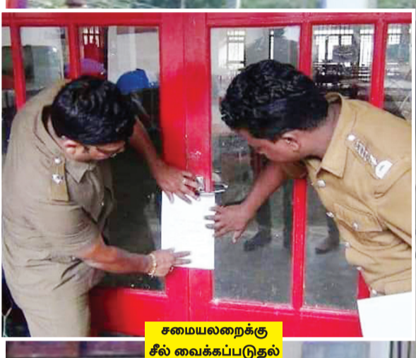
சமையலறைக்கு சீல் வைக்கப்படுதல்