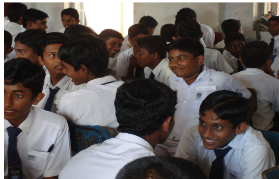
ආකෘති පත්‍ර 2 (ඇමුණුම් 2)

ආචර්ජනයෙන් පසු එකිනෙකා මුහුණට මුහුණ ලා කරන ලද යුගල ක්‍රියාකාරකමක් මගින් ඔවුහු තමා කැමති වූ අකමැතිවූ පුද්ගලයා ස්ථානය හා අත්දැකීම ඔවුනොවුන් අතර බෙදා ගත්හ.