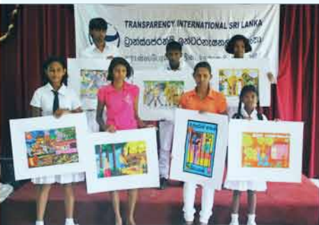
මේ නිර්මාණය මට අලුත් අත්දැකීමක් වුණා

අම්බලන්ගොඩ ප්‍රාදේශීය ලේකම් කාර්යාලයේ අභ්‍යාසලාභී උපාධිධාරීන් ඉදිරිපත්කළ චිත්‍ර භාට්‍ය සංදර්ශනයේ අවස්ථාවක්.