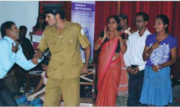
"මේ දූෂණයන් මැඩලා මොහොතක් - අපි අවට බලමු අපේ අරලා නැති බැරකම් සතර අතේ පාවෙනවා සුළඟ වගේ....."

මෙම වැඩසටහනට සමගාමීව අල්ලස් - දූෂණ පිළිබඳ පෝස්ටර් තරගයේ ජයග්‍රාහී නිර්මාණ හා ට්‍රාන්ස්පේරන්සි ඉන්ටනැෂනල් ශ්‍රී ලංකා ආයතනයේ ක්‍රියාකාරකම් ඇතුළත් ප්‍රදර්ශනයක්ද පැවැත්විණි. නගර සභා හා ප්‍රාදේශීය සභා ප්‍රධානීන්, අප ආයතනයේ සභාපතිවරයා ඇතුළු සාමාජිකයින්, පාසැල් සිසුන්, ප්‍රදේශයේ මහජනතාව ඇතුළු විශාල පිරිසක් ඊට සහභාගී වූහ.