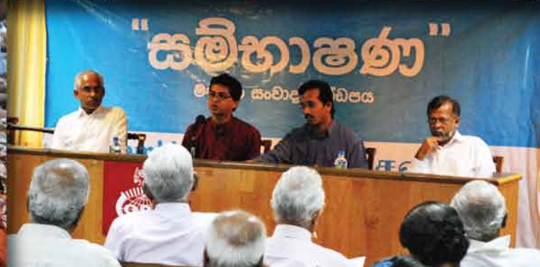
කාලීන ප්‍රශ්න සමාජ සංවාදයට ලක්කරන

“සමභාෂණ” කාලීන ප්‍රශ්න සමාජ සංවාදයට ලක්කෙරෙන “සමභාෂණ” මහජන සංවාද මණ්ඩපය යටතේ පසුගිය මාස කිහිපය තුළ ප්‍රමුඛ ප්‍රශ්න කිහිපයක් කෙරෙහි මහජන අවධානය යොමු කෙරිණි. කෝප් වාර්තාව එළිදැක්වීමත් සමඟ “කෝප් හෙළිදරව්වේ හෙට දවස?” පිළිබඳවද, විශ්ව විද්‍යාල අර්බුදය, රුපියල අවප්‍රමාණය වෙමින් මතු වූ “රුපියලේ අර්බුදය” හා “කොටස් වෙළඳපොළේ අහසන්නර ගනුදෙනු” පිළිබඳ මහජන සංවාද මණ්ඩප කොළඹදීද, මහජනතාව මුහුණ දී සිටින ඉඩම් ගැටලු පිළිබඳ සංවාද මණ්ඩපයක් “ඉඩම් කඩම් දැනමුතුකම්” ගුණ්ඵය එළිදැක්වීමට සමගාමීව අනුරාධපුරයේදී ද පැවැත්විණ. විද්වතුන්, සමාජ ක්‍රියාකාරීන්, ජනමාධ්‍යවේදීන් ඇතුළු එම විෂය ක්ෂේත්‍ර පිළිබඳ උනන්දුවක් දක්වන පුද්ගලයින් රැසක් එම සංවාද මණ්ඩපවලට සහභාගී වූහ. “සමභාෂණ” සංවාද මණ්ඩපය ජනමාධ්‍යයට හා ඒ පිළිබඳව උනන්දුවක් දක්වන පුරවැසියන් සැමට විවෘතය. සංවාද මණ්ඩපය අවසානයේ එම විෂය ක්ෂේත්‍ර පිළිබඳ ට්‍රාන්ස්පේරන්සි ඉන්වෙන්ෂන්ගේ ශ්‍රී ලංකා තත්ත්ව වාර්තාවක් නිකුත් කෙරේ.